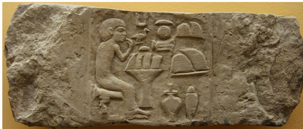
Scène de repas sur une stèle funéraire, vers 2700 av. J.C Conservée au State Museum of Egyptian Art de Munich